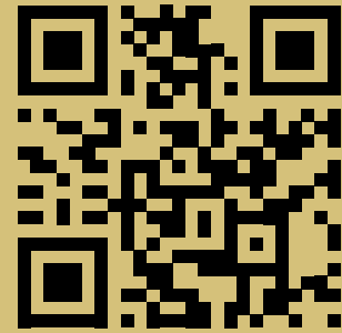
BEISPIEL SWISS DIDAC

Bei Interesse wenden Sie sich einfach direkt ans Bern Convention Bureau: meetings@bern.com